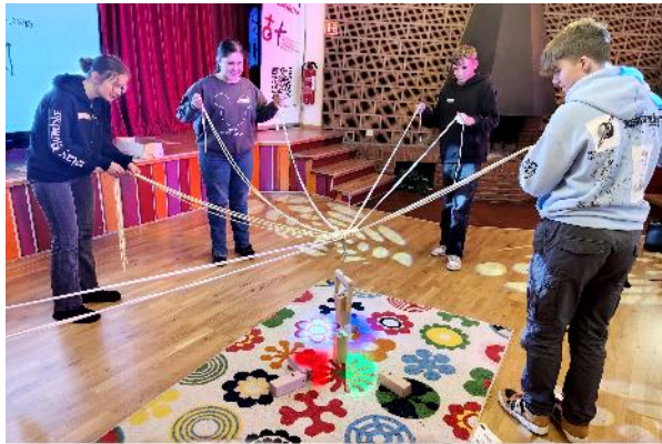
KonfiTag in der Jugendkirche Gemeinsam geht es besser - nicht nur bei diesem Turmbauspiel!

In einem Planspiel traten verschiedene Kleingruppen an fünf Stationen im Wettbewerb miteinander an. Ob beim Moonracer-Fahren Koordination gefragt war, die Schöpfungsgeschichte in die richtige Reihenfolge gebracht werden musste, ob es galt, grundlegende Regeln, also Normen und Werte, für einem neu zu besiedelnden Planeten gelten zu finden, oder ob auf der Leinwand ein neues Lebewesen zu erschaffen war - die Konfis waren ganz schön gefordert.